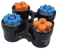
スウィングロータ SX4400 バイオセーフティ対応

最高回転数：4,700 rpm 最大遠心力：4,500 xg 容量：16本×50 mL コニカル 36本×15 mL コニカル 4本×400 mL 平底ボトル