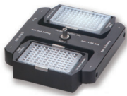
スウィングロータ S6096

最高回転数：18,000 rpm 最大遠心力：29,756 xg 容量：24本×2.0 mL