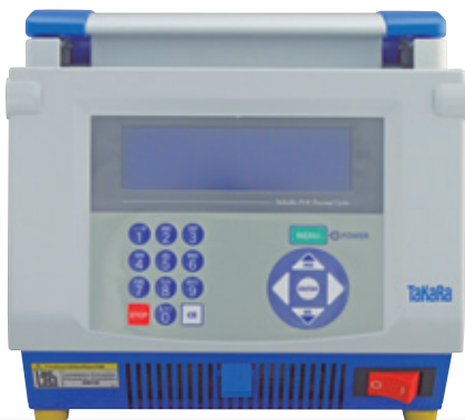
Thermal Cycler Dice® Gradient (製品コード TP600)