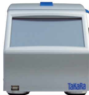
Thermal Cycler Dice® Touch (製品コード TP350)