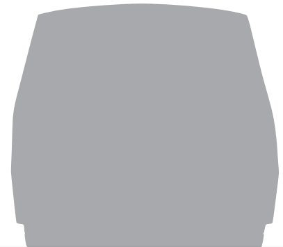
A社サーマルサイクラー

横幅 18 cm、高さ 20.5 cm、奥行き 28.5 cm(突起物含まず)という、従来製品に比べて圧倒的なコンパクト設計です(対TP600容積比42%)。