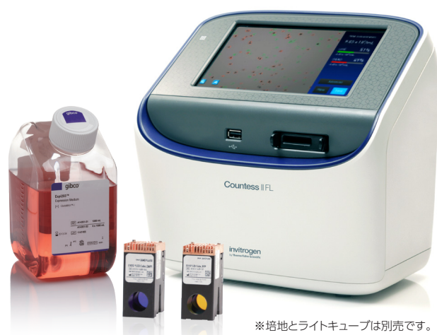
※培地とライトキューブは別売です。