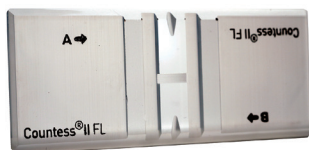
Countess II FL 専用ガラススライド (製品番号: A25750)

再利用可能な専用ガラススライドを使用いただくと、スライドコストを気にせず計測できます。