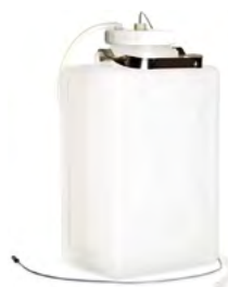
9 Lウェイストボトル