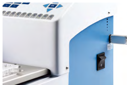
USBメモリーでプロトコルの共有やログ出力が可能