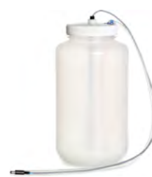
4 Lウォッシュボトル